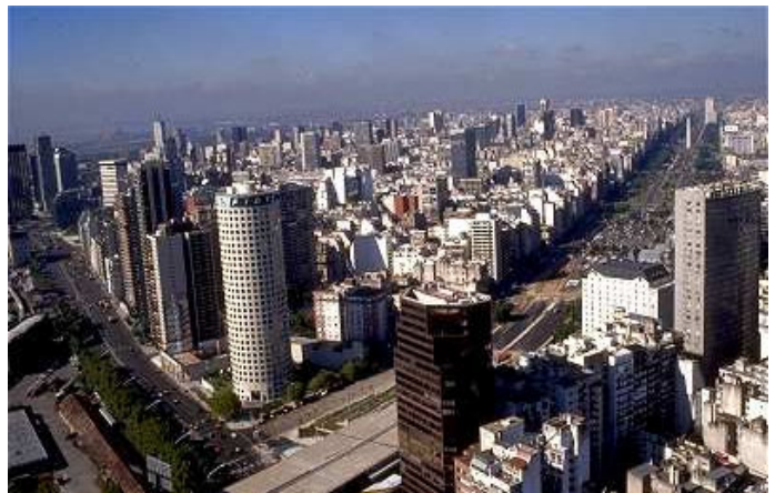
Vista de Buenos Aires

seguir apostando por el Efecto K , y, como decía en Palma el gran periodista Ernesto Ekaizer, "que éste dure para bien de todos". ; ;